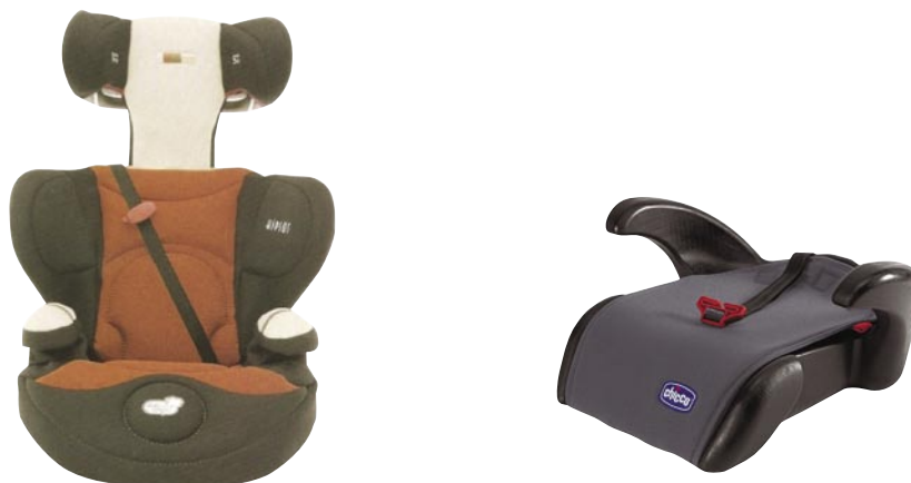
Fig. - Sistemas de retenção do grupo II/III e do grupo III