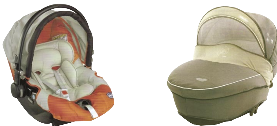
Fig. - Sistemas de retenção do grupo 0+ e do grupo 0