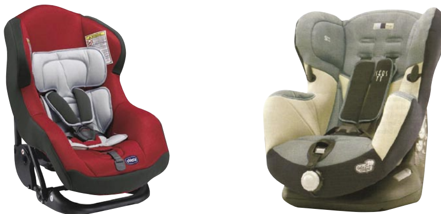
Fig. - Sistemas de retenção do grupo 0+/I e do grupo I