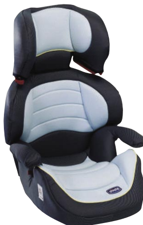
Fig. - Sistema de retenção do grupo II